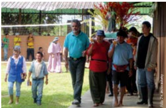
Průvod s Pannou Marií Pomocnicí

Další akcí, které jsem se mohla zúčastnit, byla taneční slavnost. Původně jsem se jela jenom podívat, a nakonec jsem i tančila. Když