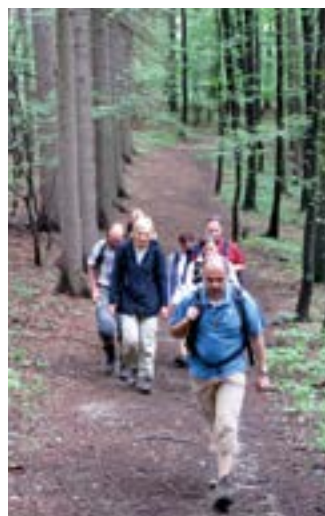
Vpřed za provinciálem!