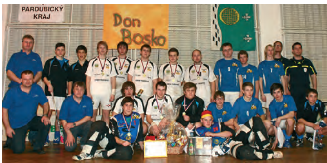
Týmy mužů z Lubné: Starší vítězové „Lubenská Smršť“, a mladší „Bratři Sokolové“, kteří obsadili čtvrté místo. Dále vpravo jsou rozhodčí a vlevo pořadatelé.

Stejně tomu tak bylo i v sobotu, kdy si do tělocvičny přijelo zahrát