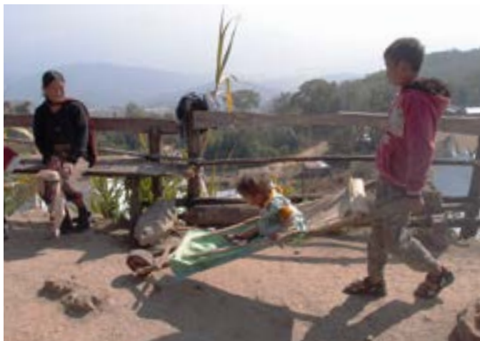
Z návštěvy v rodině