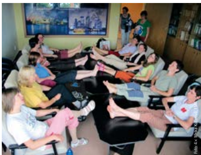
Zasloužený odpočinek znavených poutníků