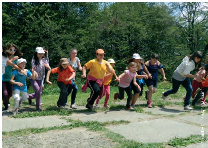
Bulharští salesiáni zaveleli na oběd...

Již se to stalo téměř tradicí, že na prázdniny přijíždí do Bulharska parta vyškolených dobrovolníků z Čech, aby pomohla s organizací letních táborů v naší salesiánské