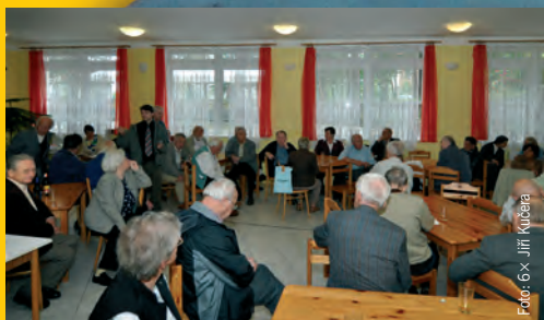
Sál pod farním kostelem, kde se setkání uskutečnilo