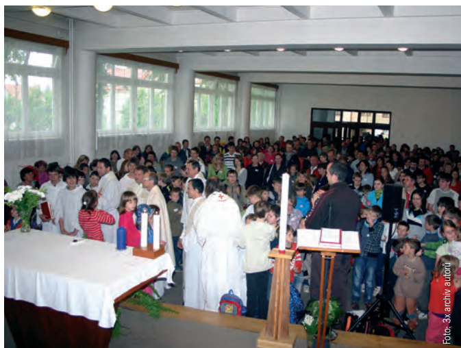
Účastníci festivalu na mši svaté