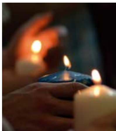
Ať svítí světlo vaše před lidmi...