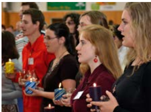
Ze slavnostního vyslání