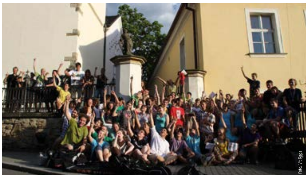
Společná fotografie po skončení SKAMu.