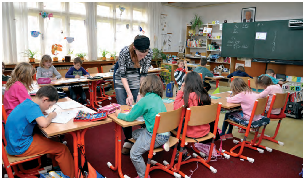
Poznáte, které z dětí je integrováno?

Další informace o škole najdete na http://www.zsintegra.cz