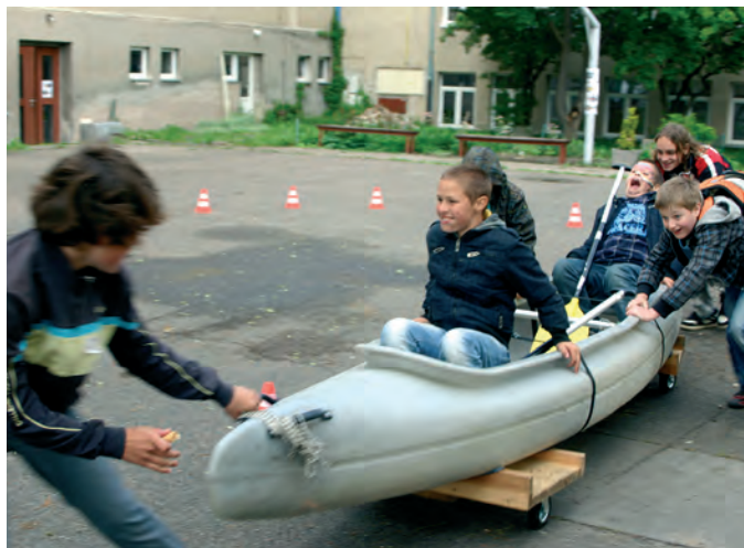
A pak že nejezdí na suchu...

nabídnutých jednotlivými kluby a společenstvími. Obzvláště děti byly velmi nadšený, co vše si mohly vyrobit a odnést domů.