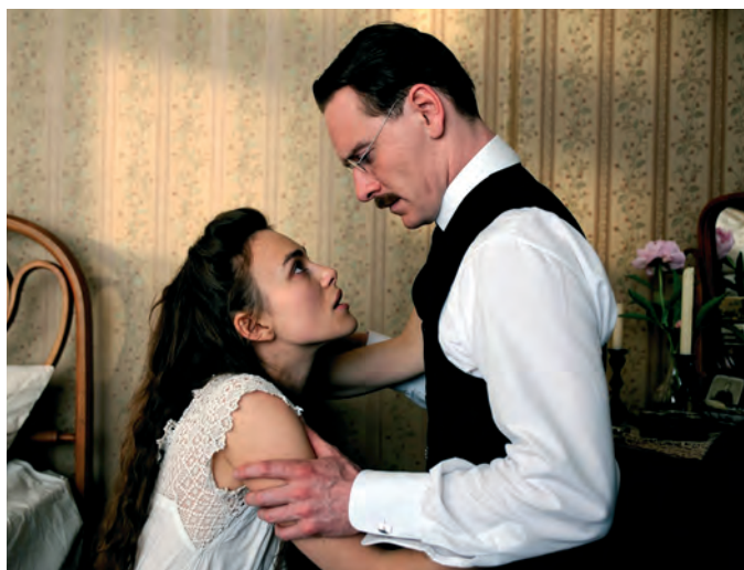
Z filmu Nebezpečná metoda