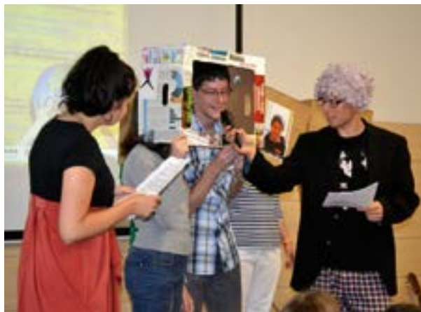
V sobotu proběhl program pro příbuzné, přátelé a veřejnost.