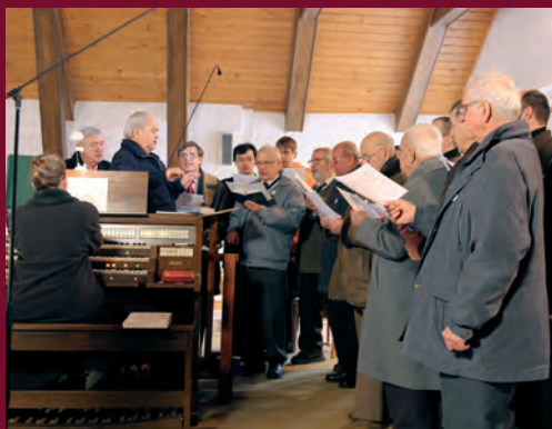
Mši svatou důstojně doprovodil havířovský mužský sbor