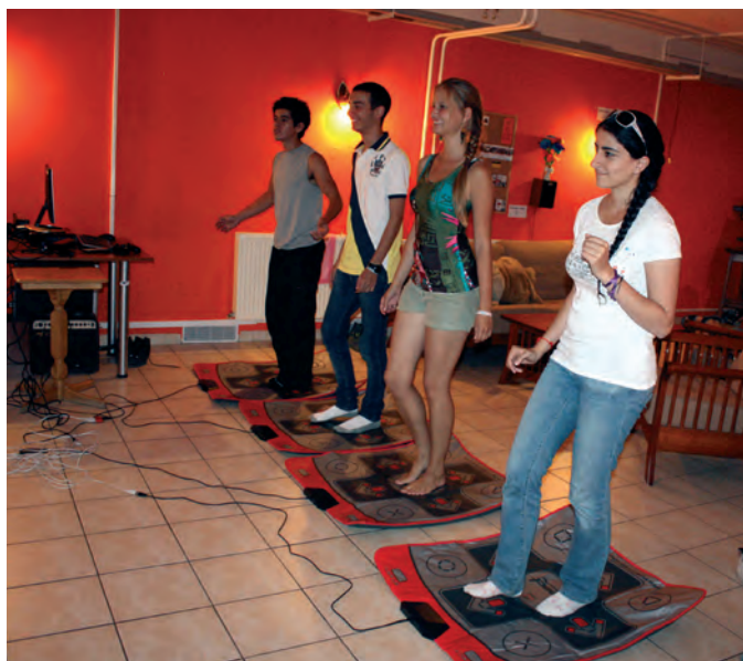
Soutěž na tanečních podložkách