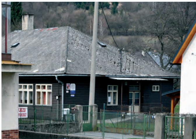
„Chaloupka“ – místo, kde všechno začalo

Stojíme tak před otázkou, za co vybudovat nový areál, na který již