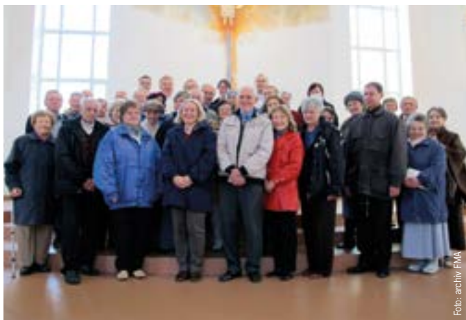
Společné foto salesiánských rodičů