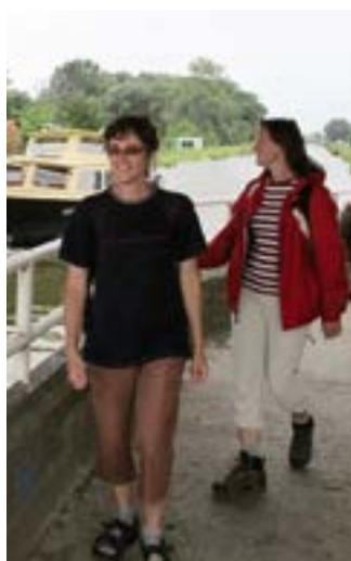
Poutníci u Baťova kanálu