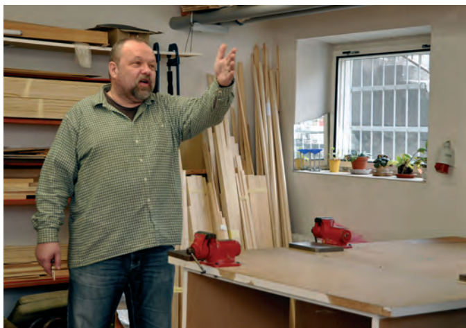
Velký důraz klademe na pracovní vyučování a osobnostní rozvoj žáků.

Jednou z velkých inspirací pro mou práci byla vlastní zkušenost se salesiánskou rodinou a jejich společenství pro mě vždy bylo oporou, jsem spolupracovník od roku 1987.