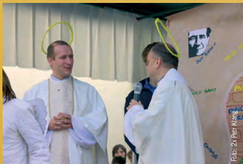
a jak je u salesiánů zvykem: bylo veselo...