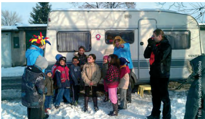
Karavan v akci

Opoledne patří karavan starším dětem, které byly dopoledne ve škole. Doučují se matematiku, češtinu