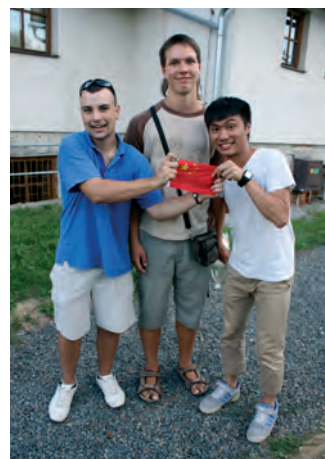
Exotic Summer Havířov-Šumbark, 2012