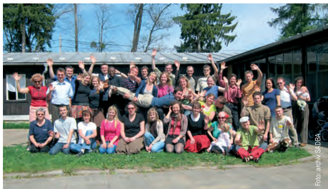
EX 2012 v Hodoňovicích

Již více než 80 mladých lidí z České republiky sloužilo během posledních 7 let několik měsíců či let v některém salesiánském díle převážně v zahraničí v rámci salesiánského misijního dobrovolnictví v programu Cagliero, nazývaného podle vůdce první salesiánské misijní výpravy (1875). Všechny spojuje jedno – intenzivní služba nejchudším dětem a mládeži v salesiánských misích. A to je zkušenost, která proměňuje život!