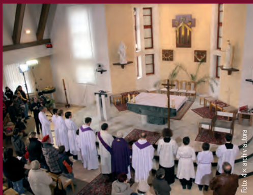
Po závěrečném požehnání zahrmělo chrámem jásavé Te Deum – Tebe, Bože, chválíme...