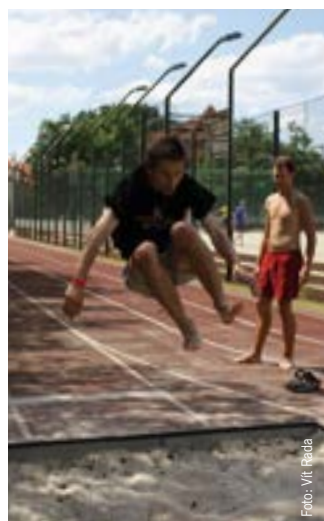
SKAM pokračoval v sobotu sportovním kláním