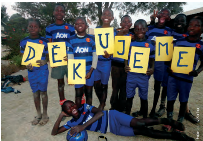
Vděčné děti z Konga

Měla jsem to štěstí, že jsem mohla deset měsíců pobývat tam, kam se obyčejný Čech jen tak nedostane. V Demokratické republice Kongo. Od konce září 2011 do července 2012 jsem tam byla po speciálním školení vyslána salesiánskou