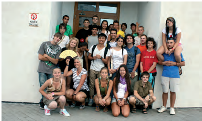
Společné foto účastníků

V rámci akce prezentovali zahraniční hosté klubu své země, zvyky, kulturu a národní pokrmy. Mladí Valdočané mohli ochutnat marocký, čínský nebo jordánský čaj, turecké sušené ovoce, vyzkoušeli si správné držení čínských hůlek, psaní v arabštině i klasické