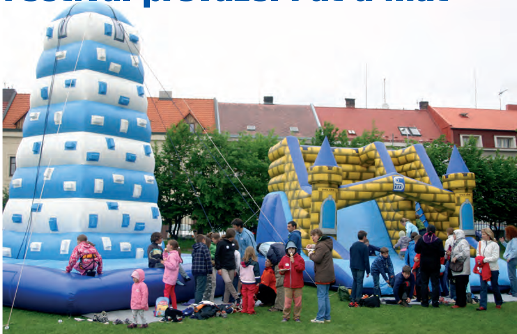
Nafukovací atrakce pro nejmenší účastníky festivalu

Rok se s rokem sešel a konečně tu byl již dlouho očekávaný den „D“. Tedy v našem případě by se hodilo napsat spíše den „F“, čili FESTIVAL 2012. Dvanáctý Festival byl nabitý bohatým programem od rána až do večera.