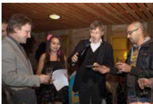
Kmotrem CD se stal režisér Petr Václav, autor filmů Paralelní světy a Marián .