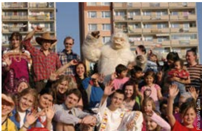
Přípravný víkend Cagliari v Teplicích

Do školy tedy jezdím pomaleji, abych stačil odpovídat na pozdravy „Good morning, sir!“ studentů, kteří jedou na kolech proti mně do jiných škol. Mimochodem, několik vesnických dětí na mě volá „Bye, Miss,“ a já je to rozhodně nebudu