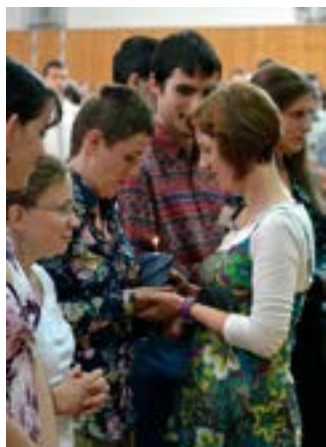
Hořící svíce – symbol dobrovolníka