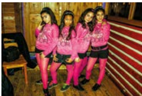
Vystoupily také Angel Twins a dívky z tanečního kroužku.

Album hip-hopové skupiny Descontrol s názvem „Myšlenky v obrazech“ si můžete objednat za 70 Kč + poštovné na adrese jiri.conka@teplice.sdb.cz .