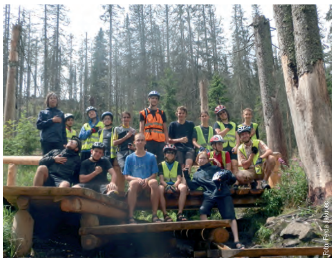
Cyklisté u pramene

I když už jsem seděla v letadle, neměla jsem ponětí, co mě vlastně