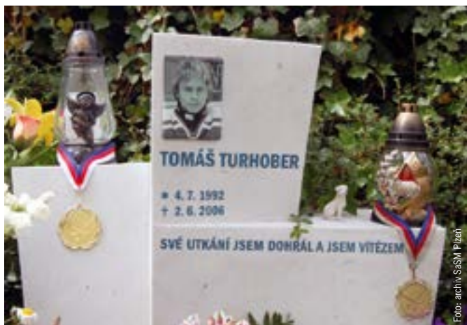
Zlatá medaile skončila i na pomníku Tomáše Turhobera

Po slavnostním zahájení ředitelem Salesiánského střediska A. Nevolou se ujal slova ředitel turnaje M. Klíma, který hráče seznámil s pravidly a hracím systémem. Hrál každý s každým a letenské áčko s vypětím všech sil obhájilo své prvenství ze všech předchozích ročníků. Na paty mu šlapala tři družstva, která měla shodný počet dosažených bodů. Ani vzájemné zápasy nestanovily jejich konečné