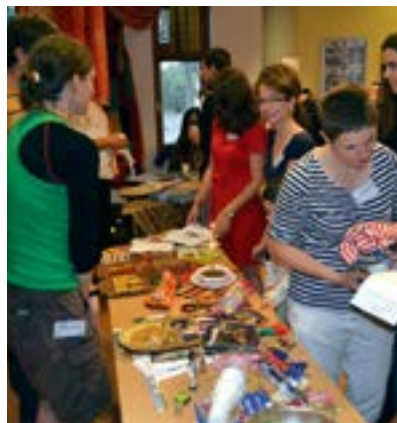
Během Aksanti se uskutečnila dražba předmětů přivezených z misí.