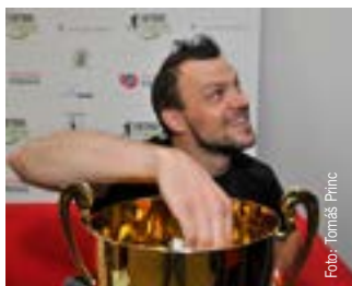
Tomáš Ujaluši během losování

Turnajový pavouk čítal dohromady 12 týmů. Sešli se v nich děti i mládež z nízkoprahových klubů, jejich pracovníci a vedoucí, zástupci pořádajících neziskových organizací i kreativci z agentury EURO-RSCG. I přes značné věkové rozdíly byly síly poměrně vyrovnané. Vyrovňovat