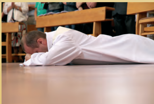
Součástí obřadu je i prostrace