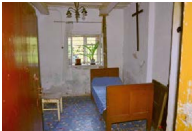
Cela jednoho z poustevníků

Do opravy poustevny se Šikutovi pustili jednak proto, že je to vzácný objekt, ale především proto, že zde plánují setkávání místní lidí, evangelizaci mládeže i dospělých, a to jak při hudebních, přednáškových a nejrůznějších salesiánských aktivitách. V budoucnu bude možné ji pronajímat na různá duchovní