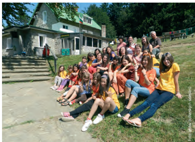
Hledáme miss Bulharsko...