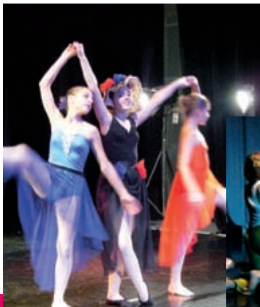
BALETKY ZE ZSUŠ NITRA ZATANCOVALY POPOLUŠKU