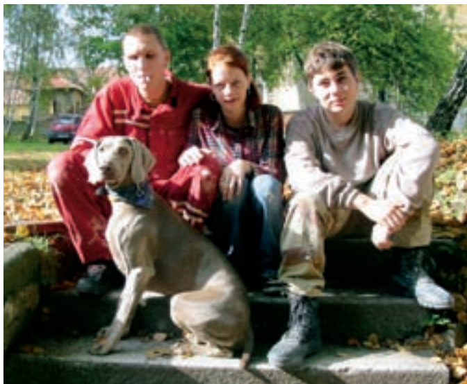
MLADÍ Z KLUBU VZDUCHOLOD NA BRIGÁDĚ V KLÁŠTEŘE

Důležitou součástí týmu jsou dobrovolníci, kteří nám pomáhají při činnosti s dětmi, podílejí se na přípravě různých soutěží, aktivit apod. Dobrovolníci ve středisku tvoří jak mládež z farnosti, která prošla animátorským kurzem a chce se podílet na činnosti střediska, tak také dobrovolníci přicházející přes organizaci Totem (loni jedna dobrovolnice z Německa, letos také jedna + dobrovolnice ze Slovenska), nebo se dobrovolníky postupně stává odrostlejší mládež (16–19letí). Těchto posledně jmenovaných letos přibývá díky řadě akcí speciálně zaměřených