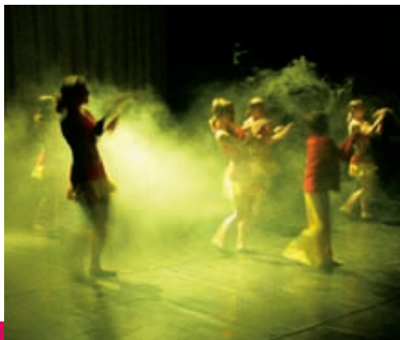
JSEM BOS PŘEDVEDL TANEČNÍ SOUBOR ZUŠ KRÁLÍKY

Již XI. roční soutěžního setkání dětských tanečních souborů z České a Slovenské republiky se uskutečnil v sobotu 13. ledna 2007 v Salesiánském divadle v Praze-Kobylicích. O putovní pohár Filipa Neriho soutěžilo 191 dětí ze 17 tanečních skupin. Pohár si po celodenním litém boji odvezli tanečnice ze ZUŠ Lounských v Praze 4. Akci již tradičně uspořádalo Salesiánské hnutí mládeže Klub Praha-Kobylisy.