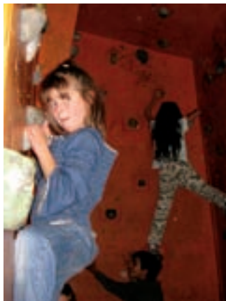
MLADÍ Z KLUBU BALÓN

Oblíbenou atrakcí je diskoteka, kterou si mladí sami připraví