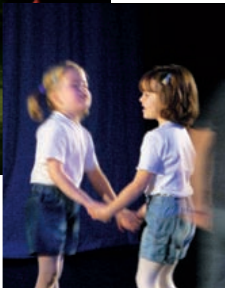
KOMINICKÝ TANEC DĚVČAT Z SHM KLUBU PRAHA-KOBYLISY – RYBKY