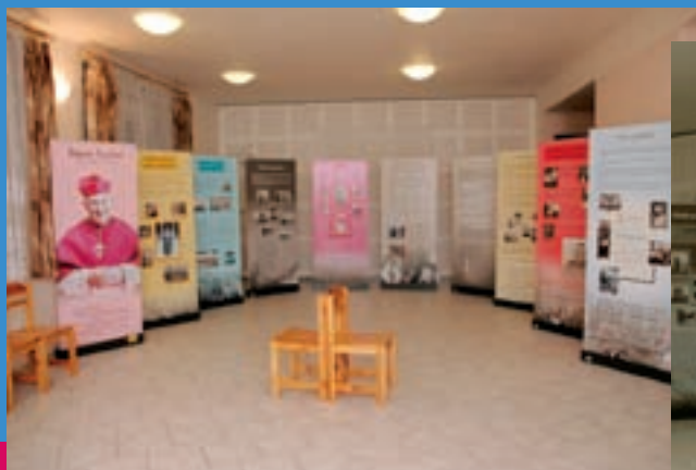
VÝSTAVA JE PŘIPRAVENA, VERNISÁŽ MŮŽE ZAČÍT.