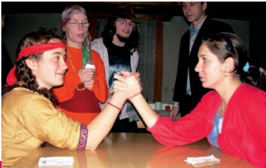
ANIMATOUR – ZÁŽITKOVÝ KURZ PRO DOBROVOLNÍKY ZE STŘEDISKA

Je to už rok a půl, co jsem přišel do Plzně na dvouletou salesiánskou pedagogickou praxi (tzv. asistenci). Pojd'te se spolu se mnou porozhlédnout po středisku.