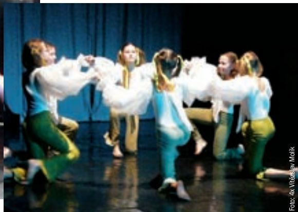
LEKNÍNY V PODÁNÍ ZUŠ PARDUBICE