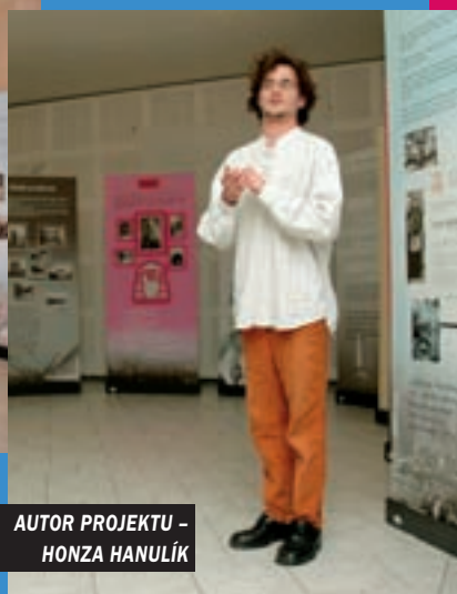
AUTOR PROJEKTU – HONZA HANULÍK