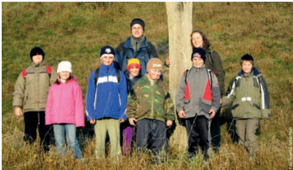
VÝLET S DĚTI Z KLUBU BALÓN

Po zážitkovém kurzu Animatour a díky výstupu na vrchol Ostrý se rozhodl pomáhat ve středisku jako dobrovolník. Jako výborný fotbalista vede nyní tréninky kluků a podílí se tak na rozvíjení talentu jednotlivých chlapců.