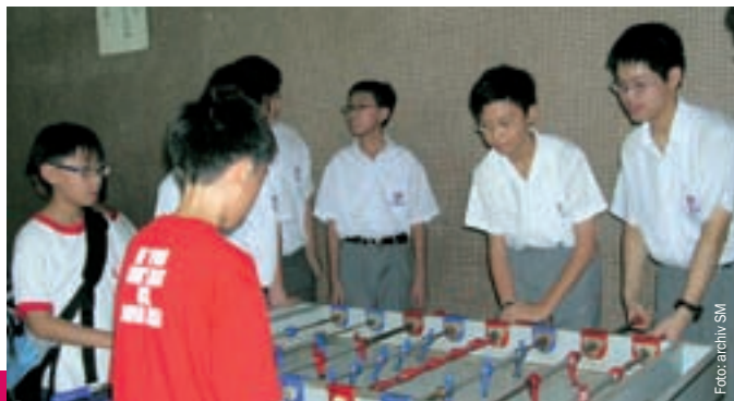
ŽÁCI ST. LOUIS SCHOOL V HONG KONGU