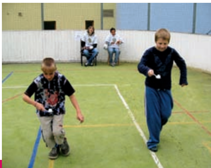
BALÓN – ZÁBAVNÉ ODPOLEDNE U PŘÍLEŽITOSTI DNE DĚTÍ