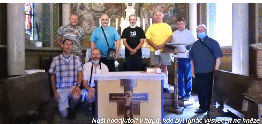
Naši koadjutoři v kapli, kde byl Ignác vysvěcen na kněze

► Vladimír Kopriva, SDB