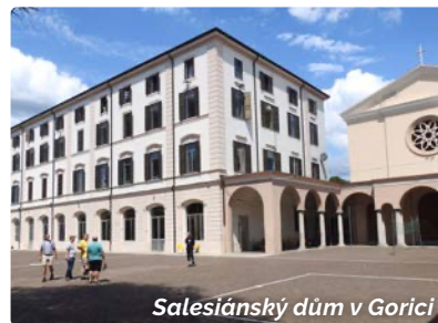
Salesiánský dům v Gorici