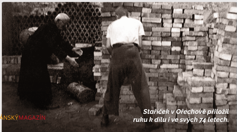
Staříček v Ořechově přiložil ruku k dílu i ve svých 74 letech.

► Vladimír Kopřiva, SDB