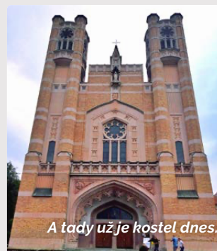
A tady už je kostel dnes.