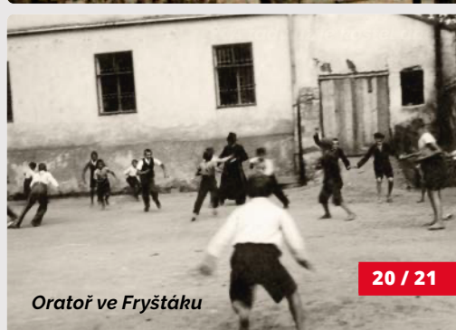
Oratoř ve Fryštáku