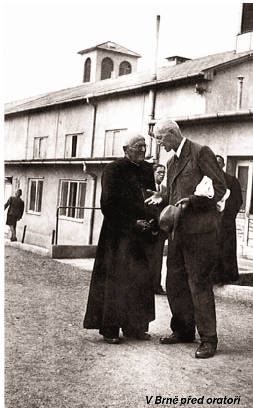
V Brně před oratoří

zповědníkem spolubratří a chlapců. Zanedlouho, 5. března 1950, prodělal první záchvat mozkové mrtvice. Po záboru ústavu komunisty ho odvezli druhého dne do charitního domova sester fran-tiškánek ve Zlíně a po jeho zrušení za několik měsíců do charitního domova v Lukově u Fryštáku, kde 17. ledna 1953 zemřel.