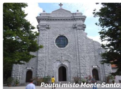
Poutní místo Monte Santo