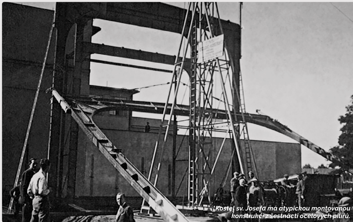
Kostel sv. Josefa má atypickou montovanou konstrukci z šestnácti ocelových pilířů.