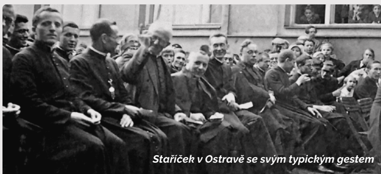
Staříček v Ostravě se svým typickým gestem

► Vladimír Kopřiva, SDB