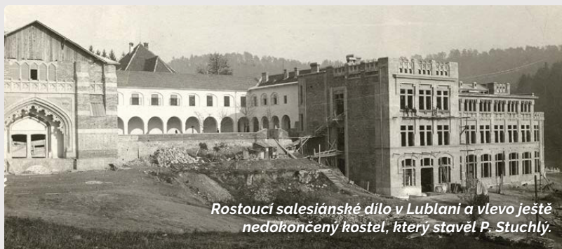
Rostoucí salesiánské dílo v Lublani a vlevo ještě nedokončený kostel, který stavěl P. Stuchlý.

► Vladimír Kopřiva, SDB