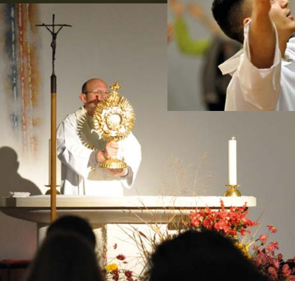
Adoramus Te, Domine!