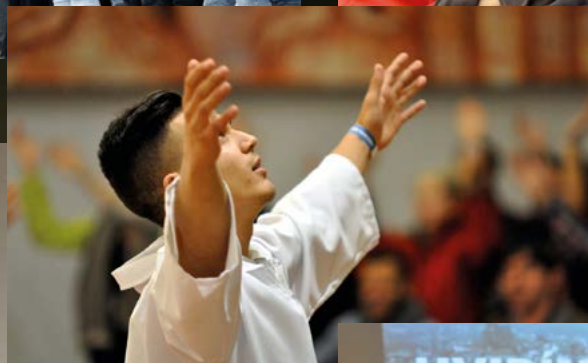
◀ Ostravské chválení