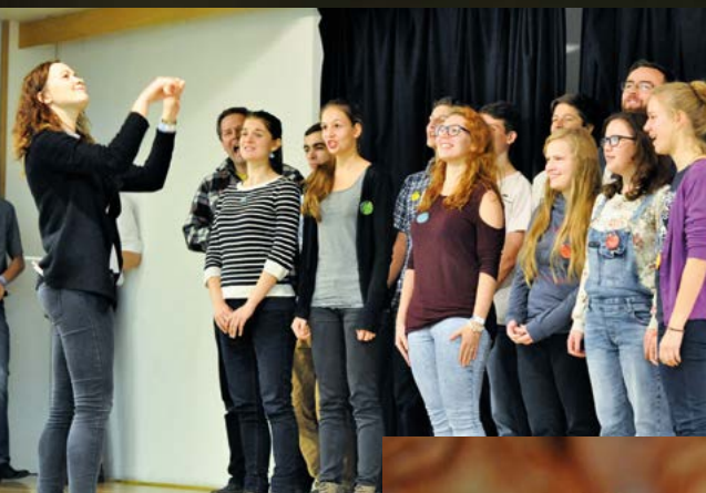
Mládí ze Sebranic