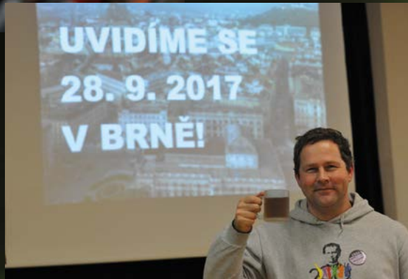
A za rok s mladými v Žabínách!